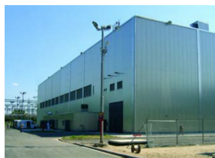
Standortzwischenlager kurz vor der Fertigstellung