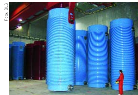
Handhabung eines Castorbehälters