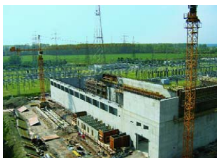
Standortzwischenlager im Bau