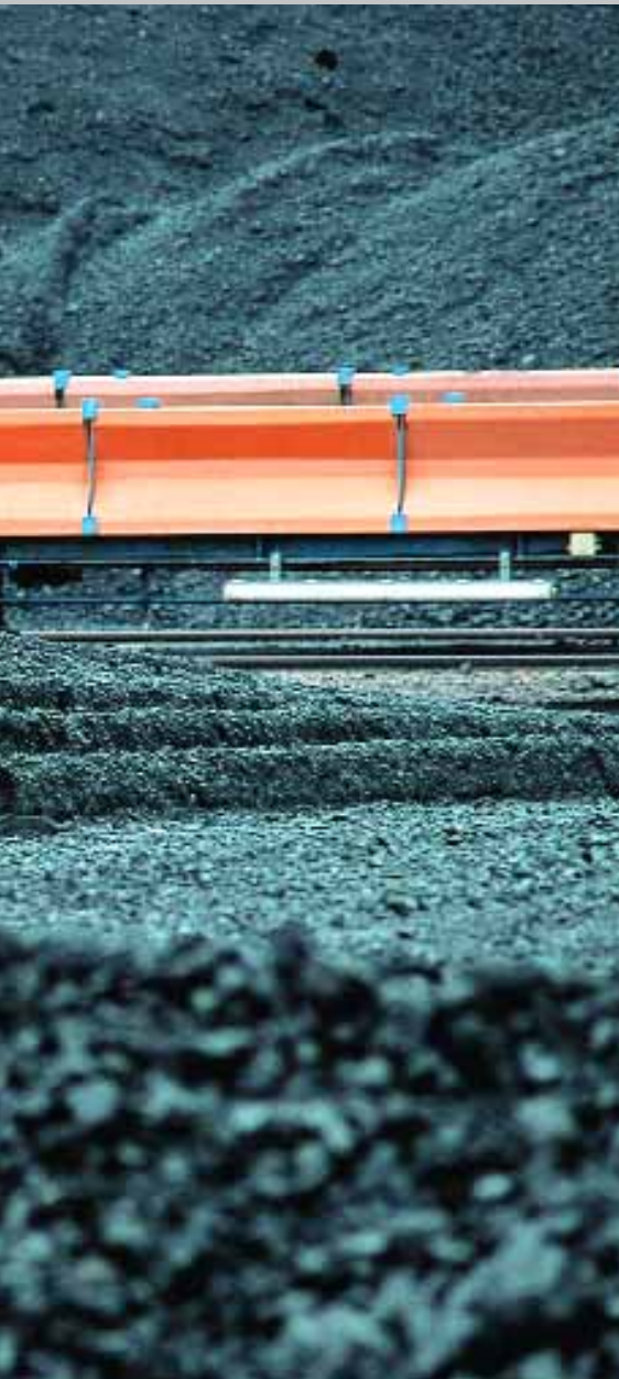
Verbindung zwischen Rauchgas- entschwefelungsanlage und Kamin von Heizkraftwerk 2