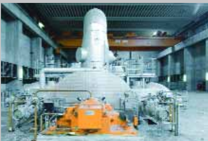
Rechts: Rauchgasaustrittsdiffusor der Gasturbine E mit Kompensator im Heizkraftwerk 2