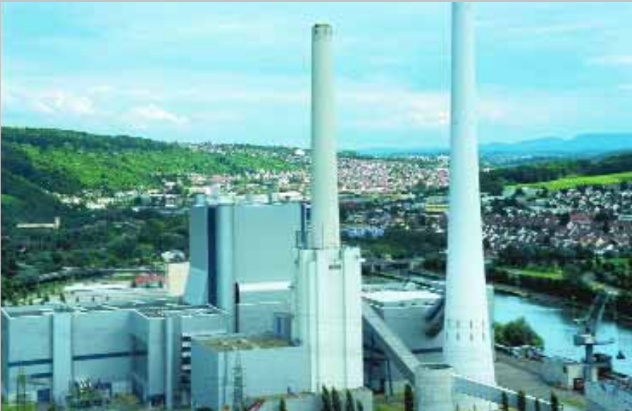
Heizkraftwerk 2 und Block 4

In den siebziger Jahren erfolgte eine grundlegende Modernisierung und Neuausrichtung der Anlage. Hierbei spielten die Aspekte Energiewirtschaft, Umweltschutz, Landschaftspflege, Naturschutz und Architektur eine wichtige Rolle. Zunächst ersetzte man den Werkteil I durch das Heizkraftwerk 1, das 1985 seinen Betrieb aufnahm. Beim Ersetzen der drei Blöcke von Werkteil II Ende der achtziger Jahre gelang es, die Kraftwerksbauten harmonisch in die Landschaft zu integrieren. Mit dem Heizkraftwerk 2 entstand eine Anlage mit fortschrittlicher Umwelttechnologie inmitten einer öffentlichen Parkanlage.