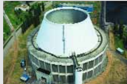
Hybridkühlturm von Heizkraftwerk 1

Der Einsatz der Trocken- und Nass-teile erfolgt wetterabhängig. Im Sommer kann bei angenehmen Lufttemperaturen und geringer Luftfeuchte der überwiegende Kühlwasseranteil durch das Nassteil gefördert werden. Bei kalten Außenlufttemperaturen und weitgehend feuchter Luft muss das Trockenteil stärker beaufschlagt werden. Auf diese Weise wird die Schwadenbildung auf ein Minimum begrenzt.