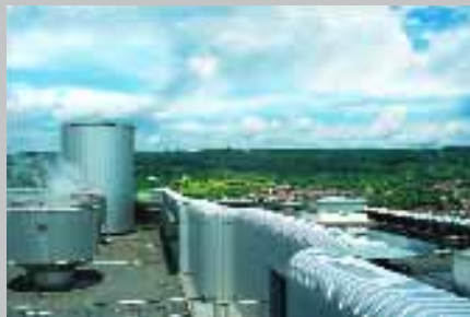
Links: Heizkraftwerk 2 und Block 4