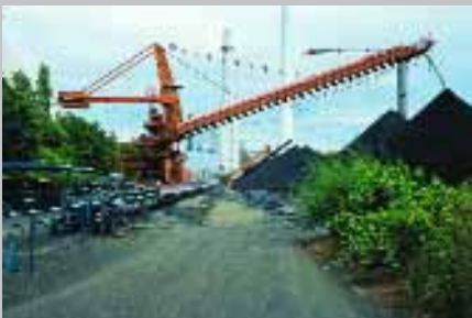
Oben: Kohlehalde und Kohleförderband vor dem Kesselhaus von Heizkraftwerk 1