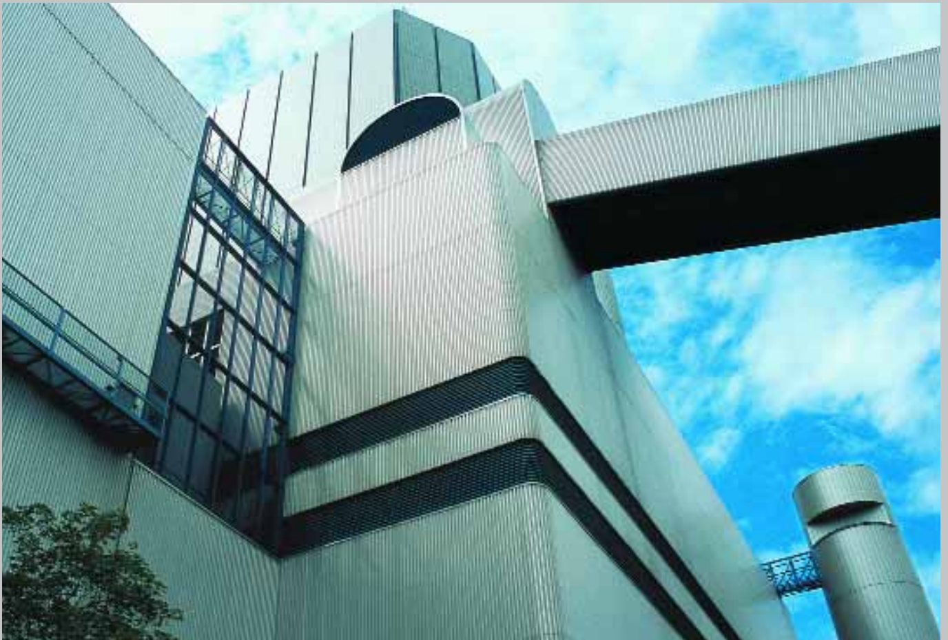
Unten: Kesselhaus und Förderband zu den Kohlebunkern von Heizkraftwerk 1