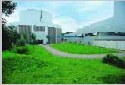
Links: Maschinenhaus von Heizkraftwerk 2 im Park des Kraftwerks