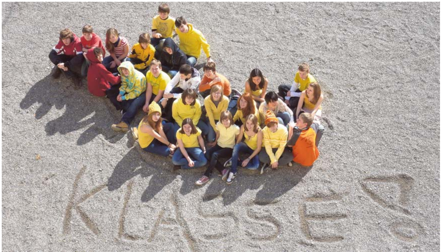
Eine große Ente auf dem Suso-Schulhof: Die Schüler der Klasse 9b haben sich in Gelb und Rot gekleidet und das Tier nachgestellt. Damit symbolisieren sie das Thema ihrer Klasse!-Seite, die Zeitungs-Ente.

Informationen im Internet: www.suedkurier.de/klasse www.enbw.com/klasse