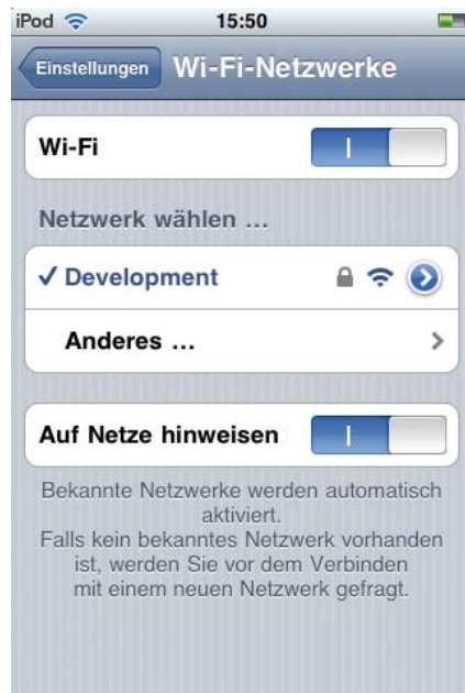
Abbildung 6: Verbindung hergestellt