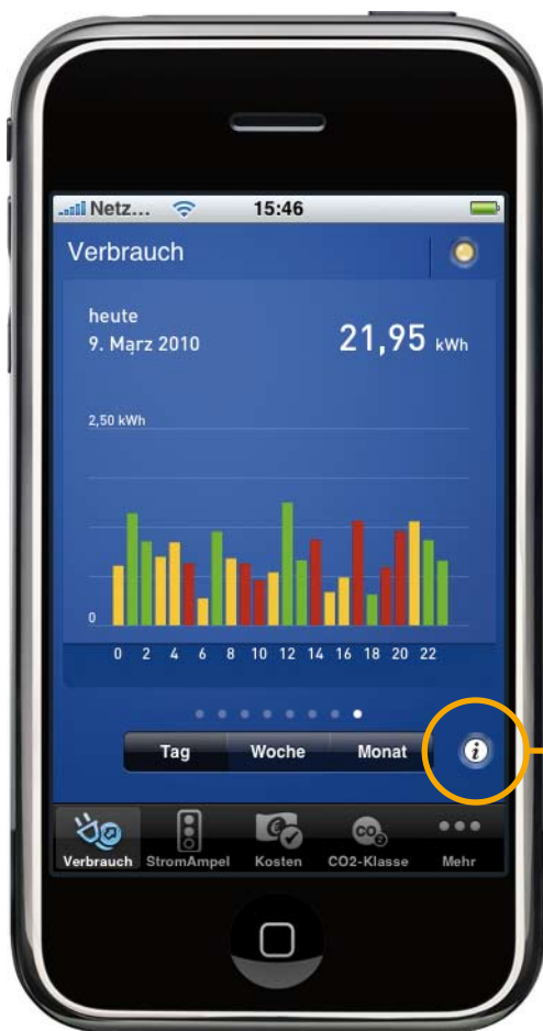
Abbildung 1: Das Informationssymbol auf dem Display

Falls Sie Fragen zu einer bestimmten Funktion im MeRegio iCockpit haben, steht Ihnen in jeder Ansicht ein Hilfetext zur Verfügung. Tippen Sie dazu einfach auf das Informationssymbol, das im Display zu sehen ist. Daraufhin erscheint ein Overlay-Fenster mit einer Erklärung zur jeweiligen Funktion.