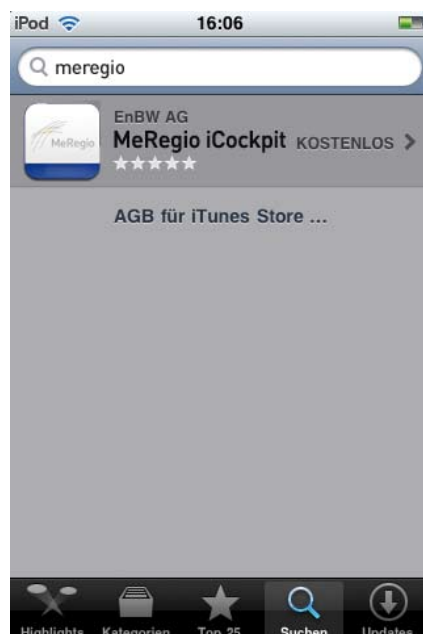
Abbildung 8: Verbindung zum iTunes-Store

> Der iTunes-Store öffnet sich. Klicken Sie in der unteren Leiste auf „Suchen“ und geben Sie anschließend im Suchfeld als Suchbegriff „meregio“ ein. Als Suchergebnis erscheint „MeRegio iCockpit“. Klicken Sie auf diesen Eintrag.