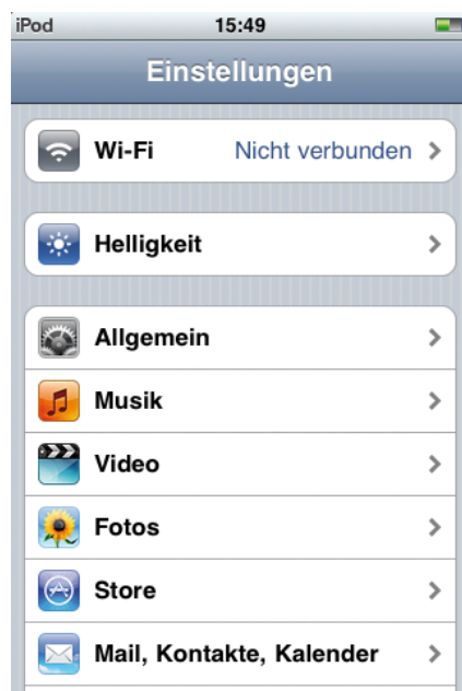
Abbildung 4: Menü unter „Einstellungen“

> Wählen Sie auf der Startseite des iPods den Button „Einstellungen“.