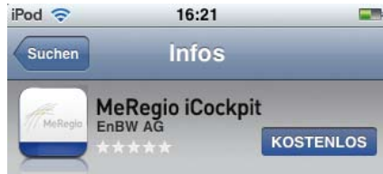
Abbildung 9 und 10: Das MeRegio iCockpit