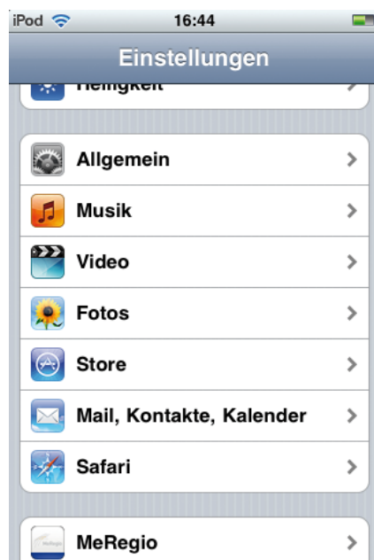
Abbildung 15: Menü unter Einstellungen

➤ Tippen Sie anschließend auf den Button „MeRegio“.