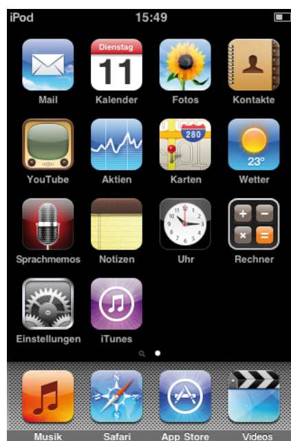
Abbildung 3: Hauptmenü mit Button „Einstellungen“

> Wählen Sie auf der Startseite des iPods den Button „Einstellungen“.