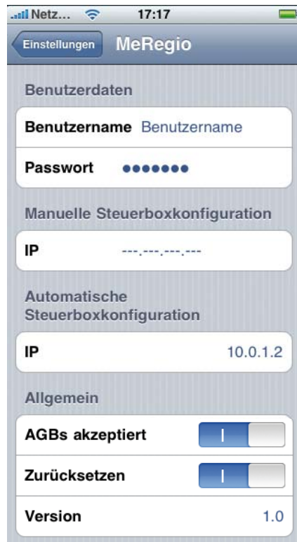
Abbildung 16: Einstellungen unter „MeRegio“