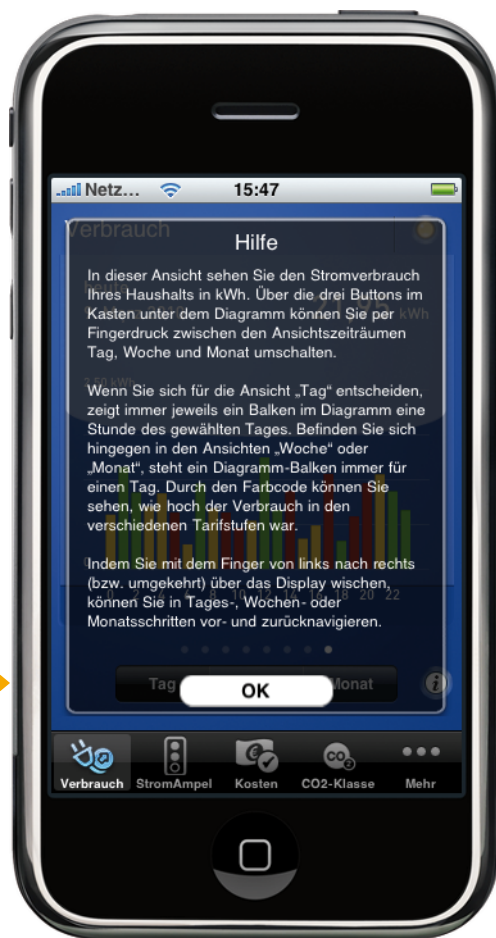
Abbildung 2: Es erscheint ein Erklärungstext zum aufgerufenen Inhalt