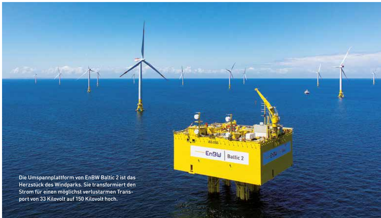
Die Umspannplattform von EnBW Baltic 2 ist das Herzstück des Windparks. Sie transformiert den Strom für einen möglichst verlustarmen Transport von 33 Kilovolt auf 150 Kilovolt hoch.