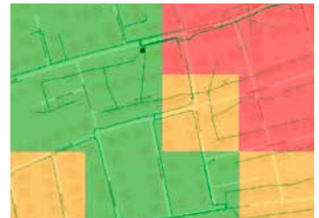
Darstellung des E-Mobilitäts-Hotspots in Ihrem Stromnetz aufgrund der soziodemographischen Analyse

Wir unterstützen Sie mithilfe eines leistungsstarken und bewährten Analyse- und Berechnungs-Tools bei der kosteneffizienten Weiterentwicklung Ihrer Verteilnetze. Am Ende steht der Plan eines Zielnetzes, das die langfristigen technisch-betrieblichen Anforderungen erfüllt und über den gesamten Zeithorizont möglichst niedrige Investitions- und Netzkosten verursacht. Bei der Integration von E-Mobilität in Ihr Stromnetz profitieren Sie von unserem FuturE-mobility AnalyseTool. Dieses Tool zeigt Ihnen schon heute die E-Mobilitäts-Hotspots in Ihrem Stromnetz von morgen.